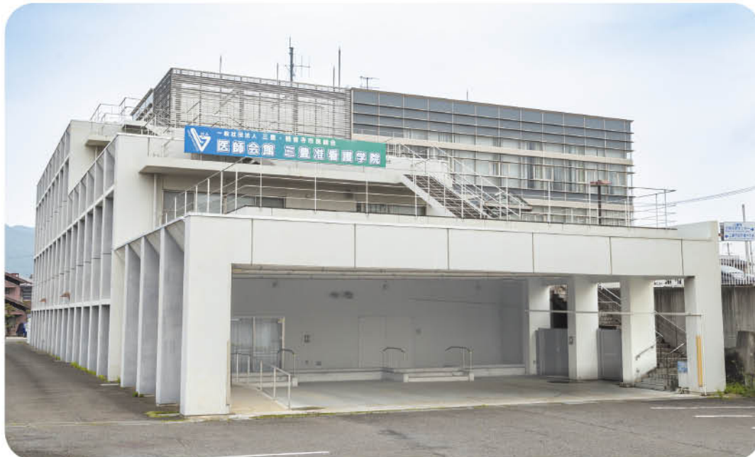
1階部分が三豊准看護学院